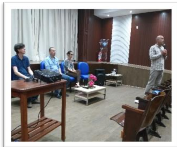
Imagem 01. Abertura da Semana de Adaptação e Acolhimento aos alunos novatos, 2019.