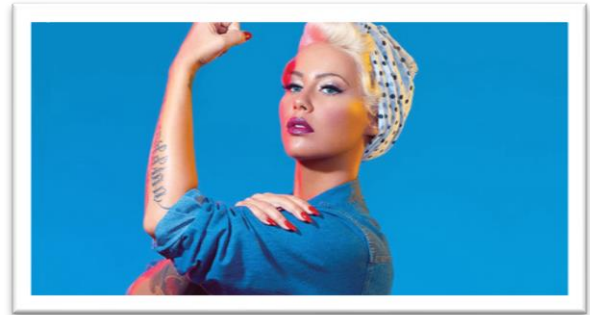
Imagem 10.