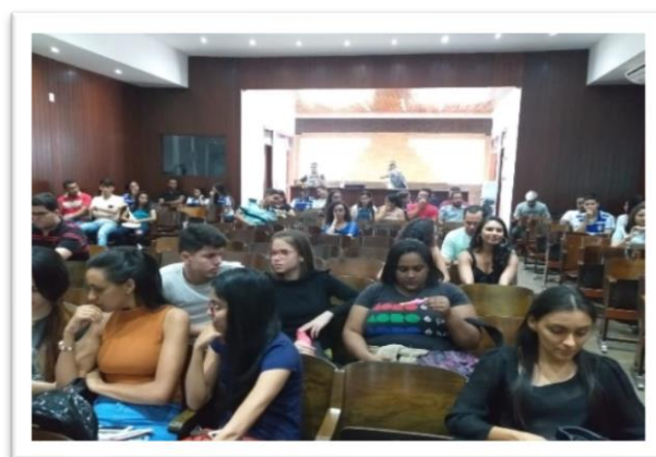
Imagem 07. VII Workshop de Ateliê de Textos Acadêmicos, 2019.

A proposta da PROPESQ é que mais atividades como essas sejam realizadas junto aos alunos do PIBIC de ambas modalidades, com o objetivo de acompanhar de perto o desenvolvimento de aprendizagem dos alunos.