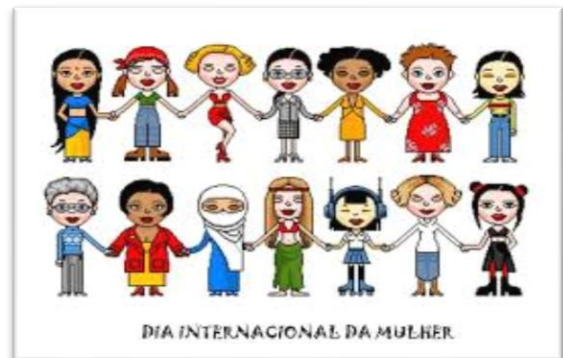
Imagem 10.

O dia 8 de março é comemorado em vários países, como a própria Rússia, onde as vendas nas floriculturas se multiplicam nos dias que antecedem a data. Na China, as mulheres chegam a ter metade do dia de folga, mas nem todas as empresas seguem essa prática. Já nos Estados Unidos, o mês de março é um mês histórico de marchas das mulheres. No Brasil, a data é marcada por protestos nas principais cidades do país, com reivindicações sobre igualdade salarial e a violência contra a mulher.