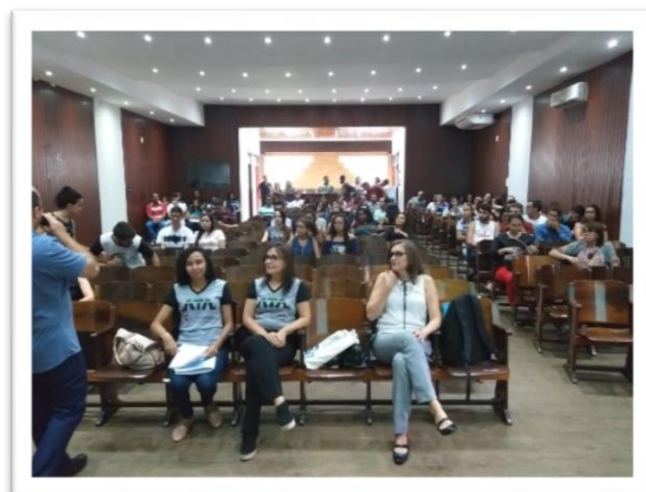
Imagem 08. VII Workshop de Ateliê de Textos Acadêmicos, 2019.