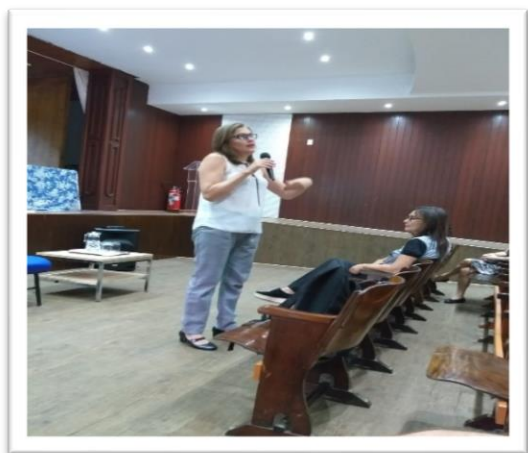
Imagem 06. VII Workshop de Ateliê de Textos Acadêmicos, 2019.